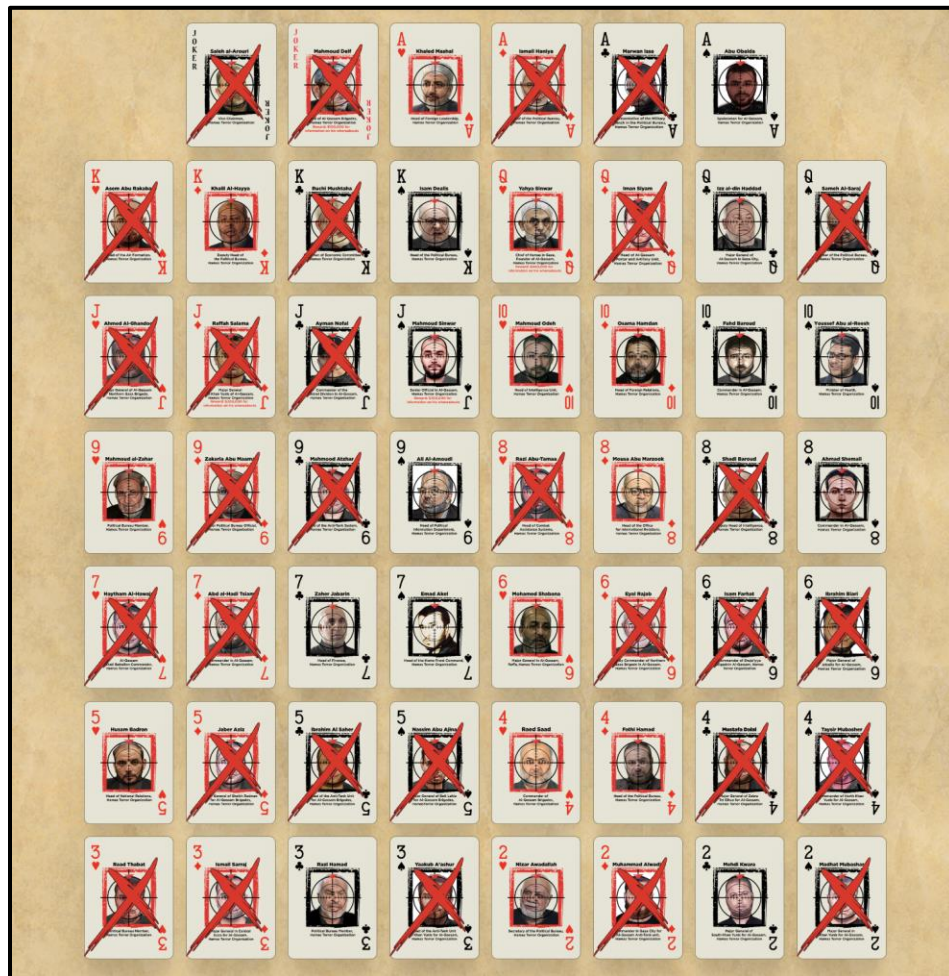
Naipes de la Muerte con Cúpula de Poder de Hamás