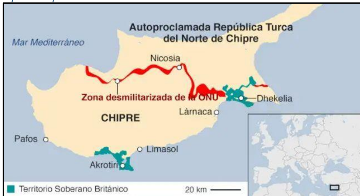
Mapa de Chipre