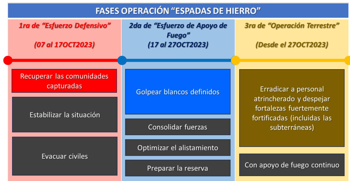
Figura N°1: fases de la operación “Espadas de Hierro”.

terrestre ofensiva, con el empleo de recursos convencionales y de operaciones especiales del comando sur, siendo apoyados por la Fuerza Aérea de Israel (FAI) y la Armada en el flanco marítimo.