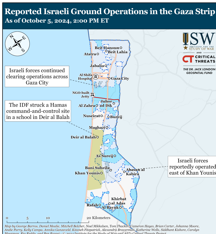
Figura N°3: operaciones en curso en la Franja de Gaza.